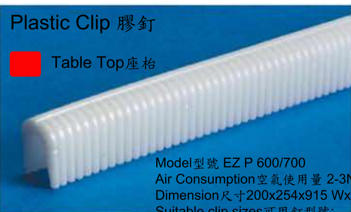
Plastic Clip 膠釘