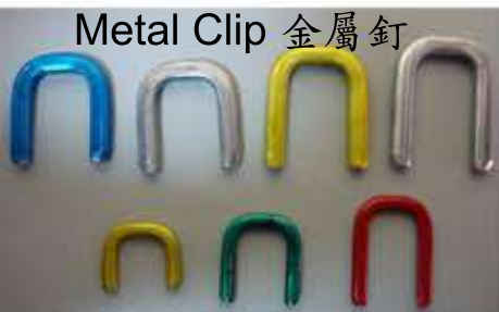
Metal Clip 金屬釘