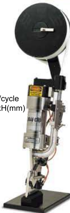
Table Top 座枱